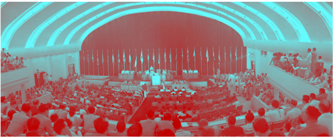
مؤتمر باندونغ، 1955

إن حقيقة لجوء الحرب والعقوبات والقمع السياسي لمحاولة كسر إرادة الشعوب له دلالة واضحة: وهي أن تنظيمنا الشعبي قوي. عندما نهتف "الشعب المتحد لن يهزم أبداً"، يجب أن نتذكر أن هذه الكلمات ليست رمزية، بل هي حقيقة تاريخية؛ لأنه حتى تحت الحصار، ومواجهة الحرب والسجن، تستمر شعوب العالم في البناء والرعاية والغناء والحب والتنظيم، وبناء حركات جماهيرية تغير مجرى التاريخ.