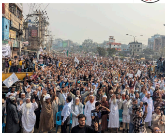
Elecciones en Bangladesh