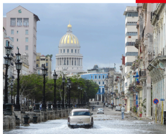
Cuba está reorganizando sus sectores de salud, educación y cultura para hacer frente al bloqueo energético de Estados Unidos