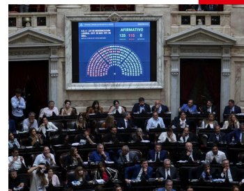
La Cámara aprueba la reforma de Milei que desmantela los derechos laborales en Argentina; el texto vuelve al Senado

La Cámara aprueba la reforma de Milei que desmantela los derechos